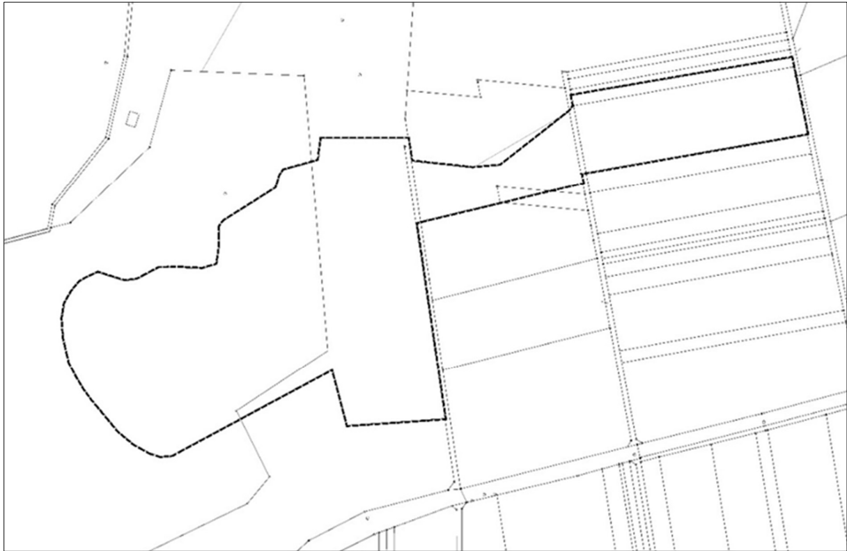
(Geltungsbereich 2 Plankarte unmaßstäblich)

Gemarkung Hofen: Flur 1 Flurstücke 34, 40/3 (allesamt teilweise) sowie 51 und 52 (vollständig)