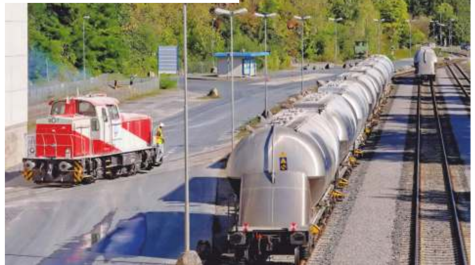
Der firmeneigene Verladebahnhof.

Die Artenvielfalt in stillgelegten Steinbrüchen ist wesentlich höher als auf den umgebenden landwirtschaftlichen Flächen.