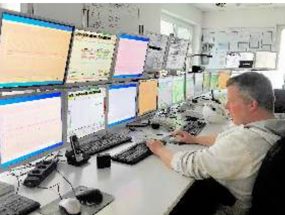
In der Steuerungszentrale werden die Brennvorgänge überwacht.

In den fast 30m hohen, das Bild des Steedener Werkes prägenden Schachtöfen, wird mittels gemahlener Braunkohle rund um die Uhr gebrannt. Die Anlage ist in hohem Maße automatisiert. In der Steuerungszentrale sind pro Schicht jeweils vier hochqualifizierte Leitstandfahrer tätig. Hier wird der ganze Prozess an unzähligen Monitoren sichtbar gemacht und in jeder einzelnen Phase überwacht und gesteuert.